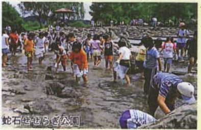
蛇石せせらぎ公園