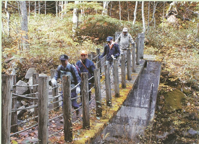
五蔵橋を渡りいざスタート