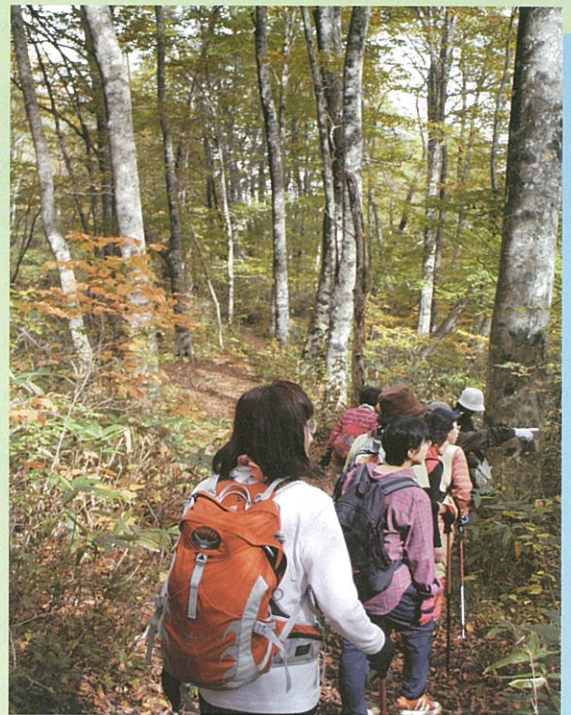
ブナの原生林があなたを待っています