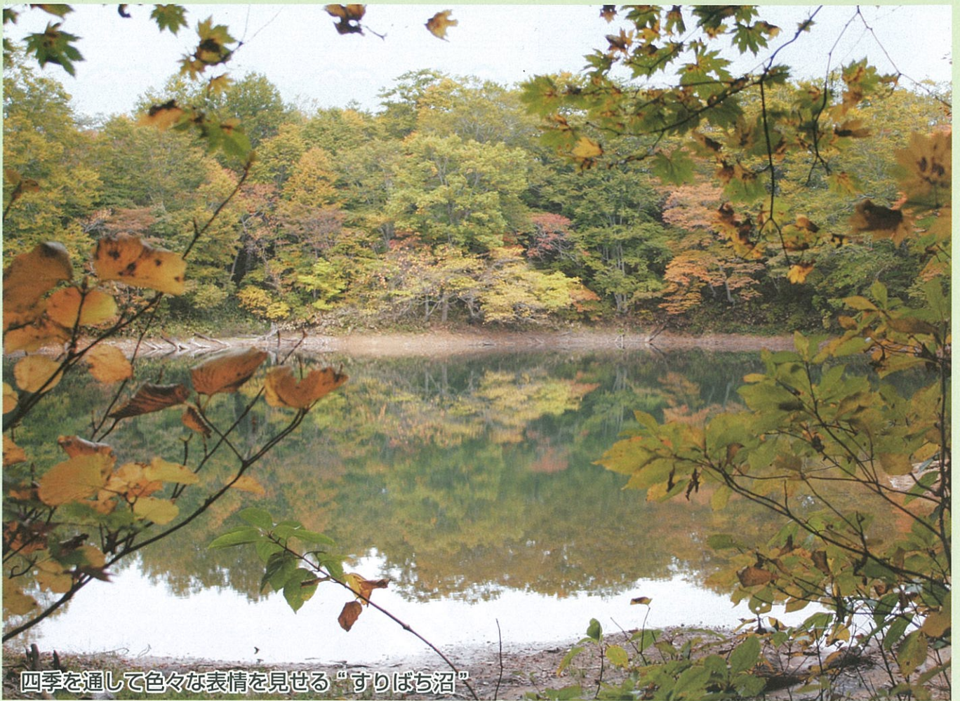
四季を通して色々な表情を見せる“すりばち沼”

船形山は、別名“御所山”とも呼ばれている県立自然公園船形連峰の主峰で、標高は1,500m。この船形山に登る登山道（升沢コース）の入口に旗坂野営場がある。升沢自然遊歩道は、この旗坂野営場を入口とし、県道升沢吉岡線（小荒沢橋）までの5.1Km（約2時間）のコースです。