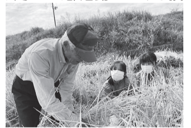
ボランティア活動の様子

子どもたちの成長のため、やる気のある方ならどなたでもボランティア活動ができます。登下校時の児童の見守りや、図書の読み聞かせ、部活動における技術指導など、活動の内容はさまざまです。ご協力いただける方や、興味のある方は、生涯学習課へお問合わせください。