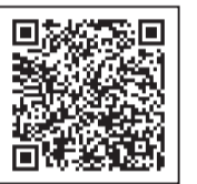
「おとう飯」始めよう キャンペーン

初心者にもわかりやすいレシピが多数ですので、料理になれていないお父さんのみならず、普段の献立にお悩みの際にもオススメです。