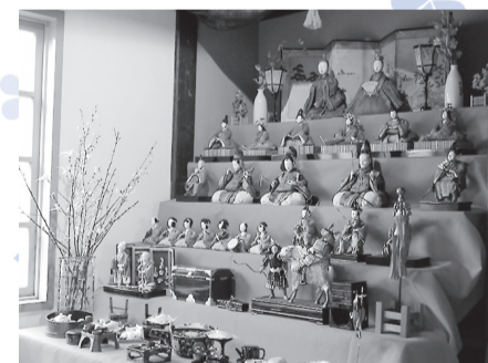
※原阿佐緒記念館での展示の様子