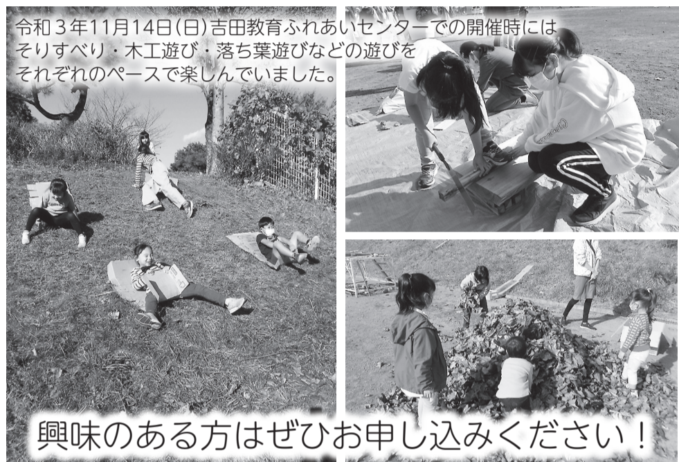
令和3年11月14日(日)吉田教育ふれあいセンターでの開催時にはそりすべり・木工遊び・落ち葉遊びなどの遊びをそれぞれのペースで楽しんでいました。