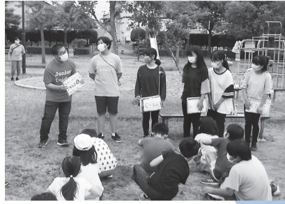
子ども会行事での活動の様子