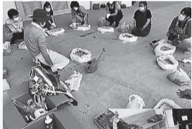
◀ はじめての家庭菜園

新型コロナウイルス感染症の影響により一部中止となった講座もありますが、今年度のまほろば大学も多くの講座を実施することができました。