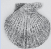
カネハラニシキ(貝)

入 館 料：一般210円／大学生160円／ 中学・高校生110円／小学生以下無料 (20人以上の団体は割引あり)