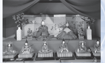
原家ゆかりのひな人形(原阿佐緒記念館)