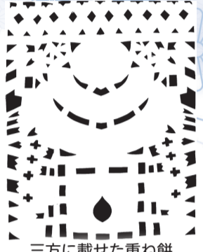
三方に載せた重ね餅