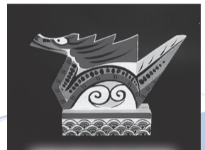
板籠(福島県三春町)