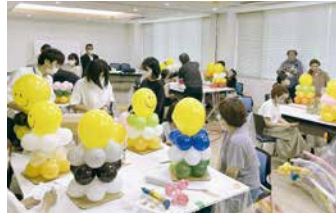
◀バルーンアート講習会 令和5年6月10日(出)