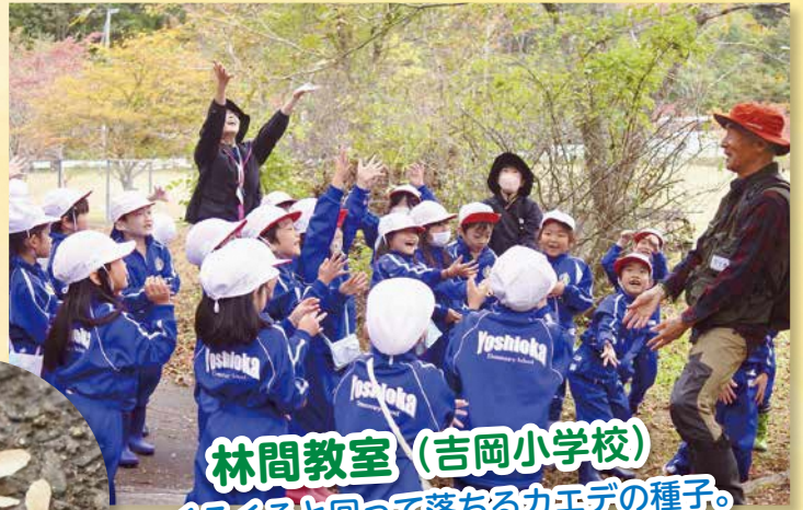
林間教室 (吉岡小学校)