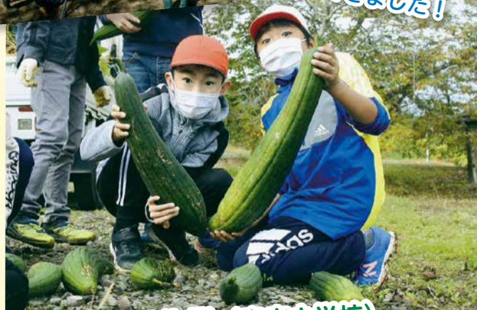
農園作業 (宮床小学校)