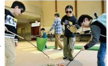
地区交流研修会▶ 12月16日(出)