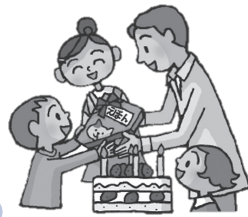
絵本をプレゼント!

テレビ・DVDなどの映像メディアと親の語りかけには違いがあります。テレビなどは子どもの興味・関心に関係なく一方的にうつされますが、読み聞かせはその子のペースで見たり、会話をしたりしながら読み進めることができます。