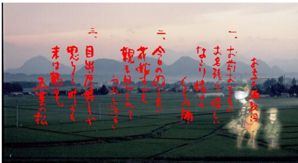
民謡「お立ち酒」歌詞