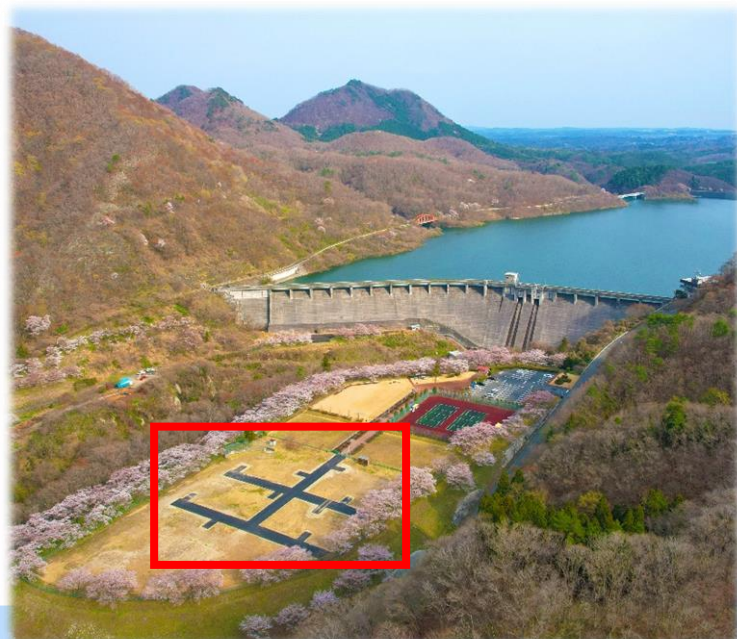
令和4年度に企業様からの寄附を活用して整備したキャンプ場