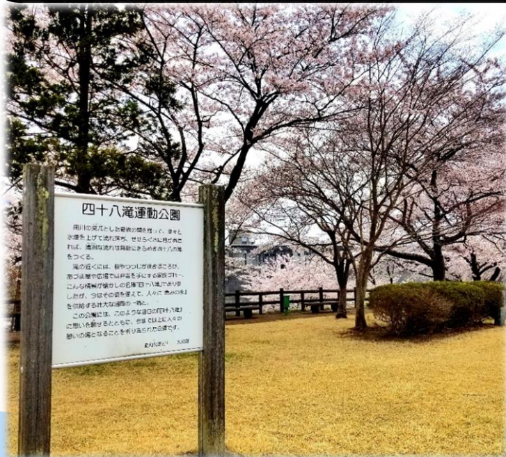
四十八滝運動公園

七ツ森湖周辺の観光周遊の拠点を創出するため、令和5年度は四十八滝運動公園内への遊具の設置などを行います。